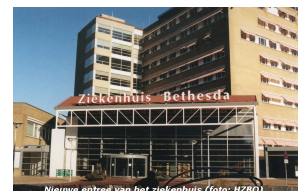
Nieuwe entree van het ziekenhuis